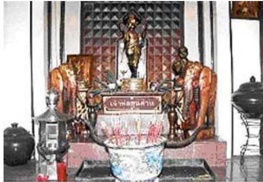
พระบรมราชานุสาวรีย์ "พระบาทสมเด็จพระจุลจอมเกล้าเจ้าอยู่หัว"