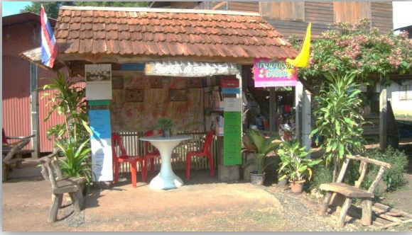
บ้านหนังสือชุมชนบ้านจันใต้ อ.ปทุมรัตต์ จ.ร้อยเอ็ด