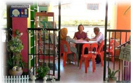
บ้านหนังสือชุมชนบ้านพลีไต้ อ. นาทวี จ.สงขลา