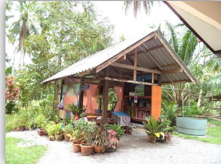
บ้านหนังสือชุมชนบ้านปากแพรก อ.บางสะพานน้อย จ.ประจวบคีรีขันธ์