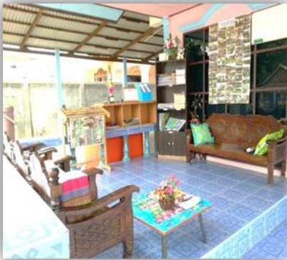
บ้านหนังสือชุมชนบ้านไต้ล้ง อ.กระทุ่มแบน จ.สมุทรสาคร