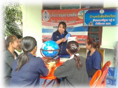
บ้านหนังสือชุมชนบ้านหนองอีบุตร อ.ห้วยผึ้ง จ.กาฬสินธุ์