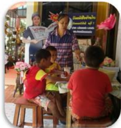
บ้านหนังสือชุมชนบ้านหนองบัวดีหมี อ.เมืองขอนแก่น จ.ขอนแก่น