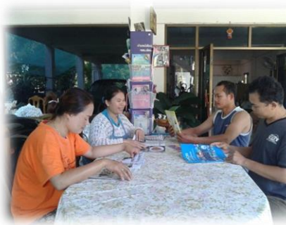
บ้านหนังสือชุมชนบ้านโพธิ์ชัย อ. เวียงชัย จ. เชียงราย