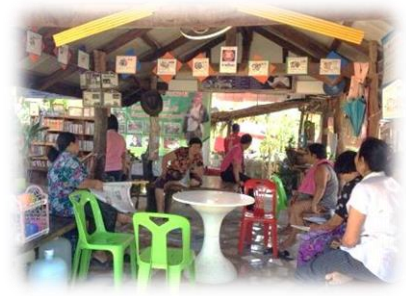
บ้านหนังสือชุมชนบ้านหนองแคน อ.ปทุมรัตต์ จ.ร้อยเอ็ด