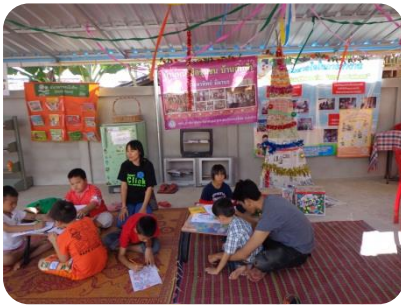
บ้านหนังสือชุมชนบ้านสบฟ้า อ. แจ้ห่ม จ.ลำปาง

การดำเนินงานบ้านหนังสือชุมชน มีเป้าหมายให้เกิดความสำเร็จอย่างยั่งยืน ควรเกิดจากการมีส่วนร่วมของชุมชนและเครือข่ายในทุกขั้นตอนของการดำเนินงาน เช่น การบริหารจัดการ การรับบริจาคสื่อ การหมุนเวียนสื่อ การร่วมจัดกิจกรรม (ร่วมคิด ร่วมทำ ร่วมให้ข้อเสนอแนะ) การระดมทรัพยากร การประชาสัมพันธ์ เป็นต้น