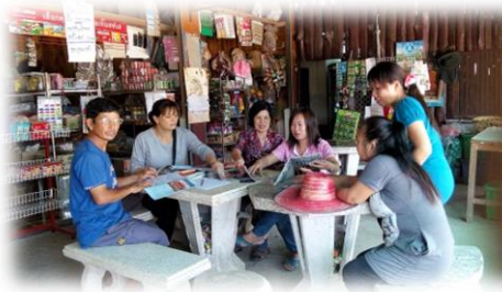
บ้านหนังสือชุมชนบ้านตีนธาตุ อ.พริ้ว จ.เชียงใหม่