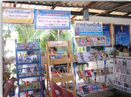
บ้านหนังสือชุมชนบ้านสระบัว อ.ปทุมรัตต์ จ.ร้อยเอ็ด