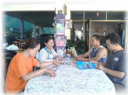
บ้านหนังสือชุมชนบ้านโพธิ์ชัย อ.เวียงชัย จ.เชียงราย

2.2 การจัดหาสื่อสำหรับให้บริการในบ้านหนังสือชุมชน สามารถทำได้หลายวิธี เช่น การจัดซื้อ การรับบริจาค การทอดผ้าป่าหนังสือ การตัดกบัตรหนังสือ การยืมและหมุนเวียนสื่อจากห้องสมุดประชาชนสู่บ้านหนังสือชุมชน กศน. ตำบลสู่บ้านหนังสือชุมชน บ้านหนังสือชุมชนสู่บ้านหนังสือชุมชน เป็นต้น