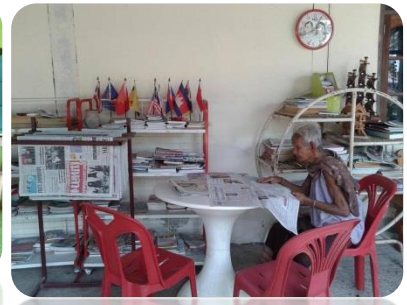
บ้านหนังสือชุมชนบ้านนาแค อ. ปทุมรัตต์ ร้อยเอ็ด