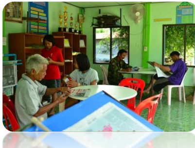
บ้านหนังสือชุมชนบ้านฮ่องแอ อ.ปทุมรัตต์ จ.ร้อยเอ็ด